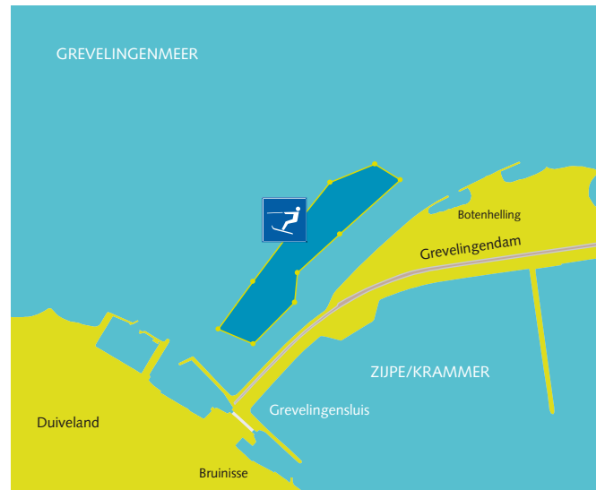
Grevelingenmeer: Grevelingendam (kaartje 2)