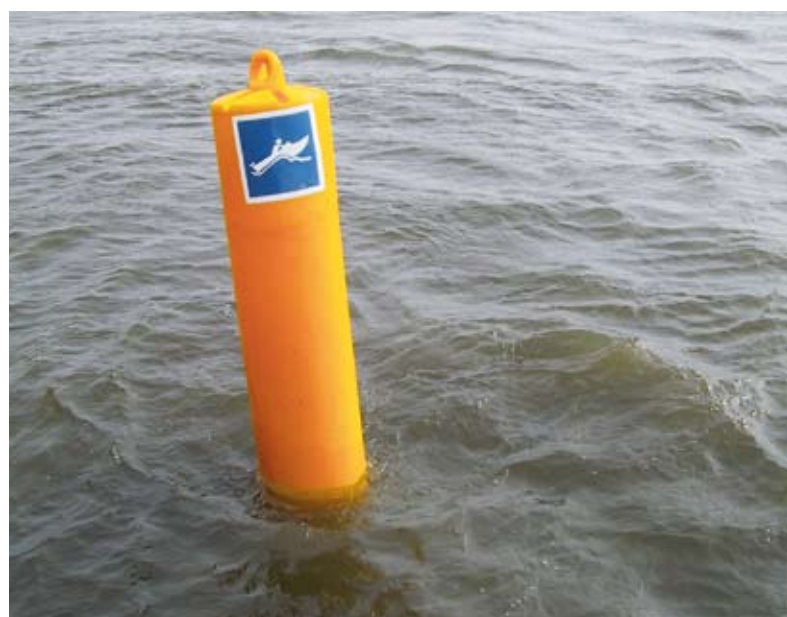
Geel drijfbaken ter markering van snelvaargebied

De gele drijfbaken zijn voorzien van het pictogram E.20.1. Uit praktische overwegingen zijn de andere verkeerstekens op of in het water niet aanwezig, maar ze kunnen wel voorkomen op bepaalde plaatsen op de oever.