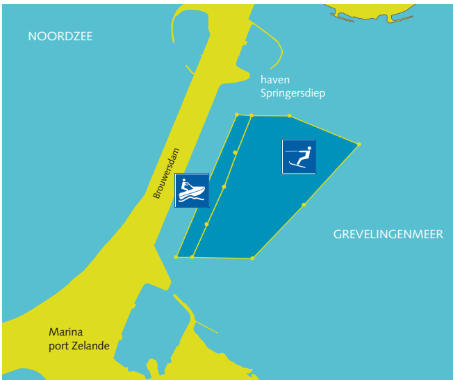
Grevelingenmeer: Brouwersdam (kaartje 1)