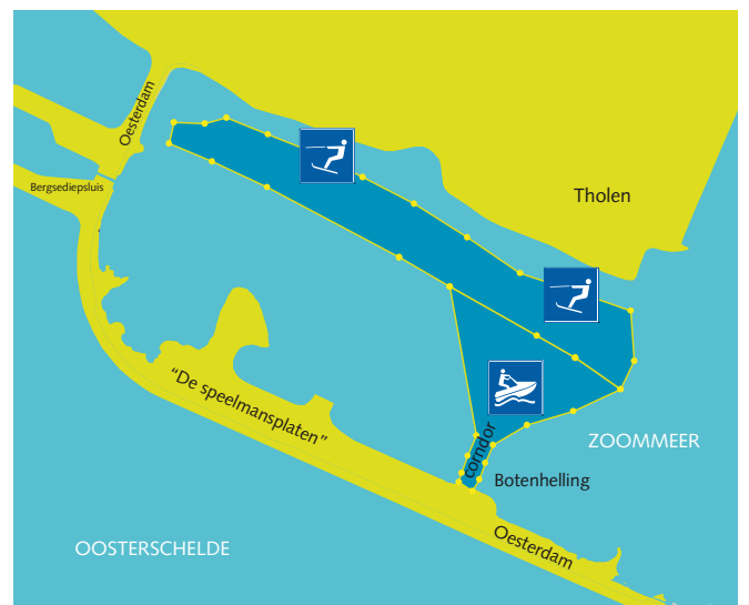
Zoommeer (kaartje 6)