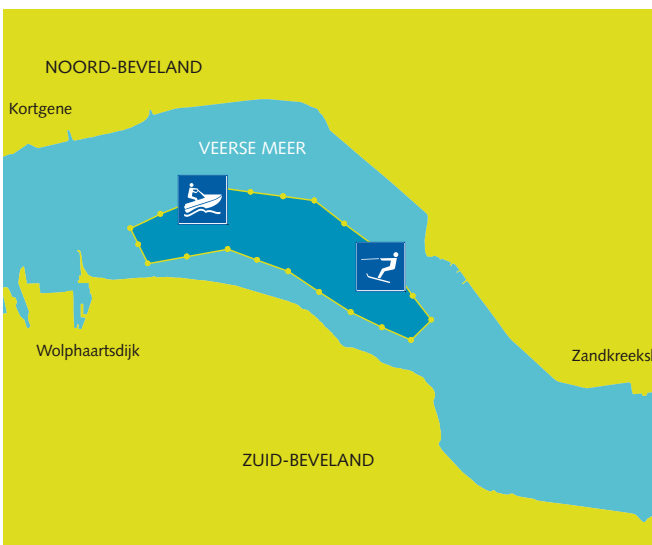
Veerse Meer (kaartje 5)